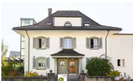
Gartenstrasse 6 . 4665 Oftringen