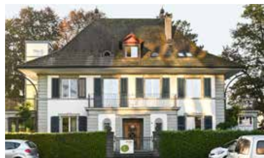
Henzmannstrasse 1 . 4800 Zofingen