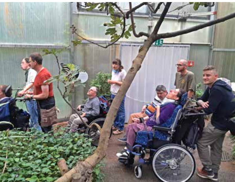
Ausflug ins Papilliorama