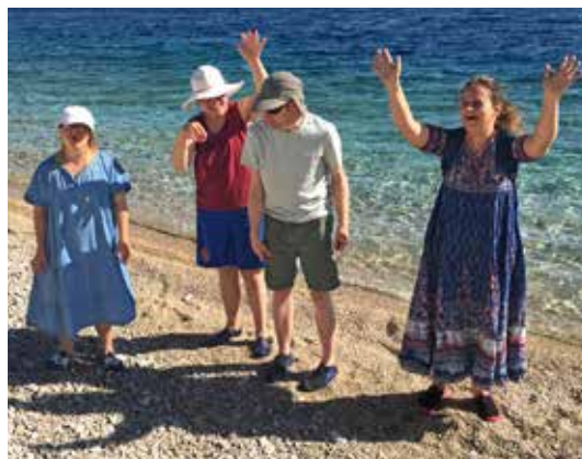
Ferien am Bodensee