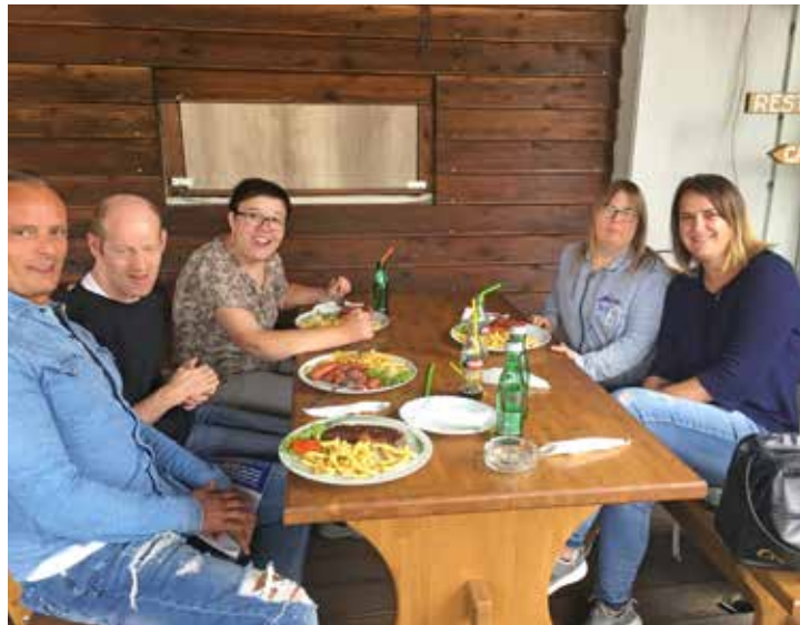
Ferien in Kroatien