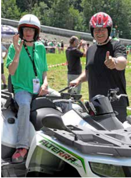
Erlebnistag Marti AG